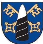
Městská část Praha 12